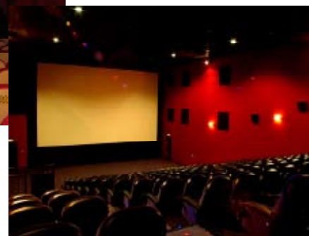
Planowane wyposażenie sali kinowej