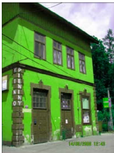
Obecny stan budynku

Realizacja projektu pozwoli z jednej strony na zachowanie budynku pełniącego funkcje centrum kultury a z drugiej strony na dokonanie jakościowej zmiany w charakterze oferowanych usług kulturalnych. Wykonane prace w ramach rewaloryzacji budynku, spowodują, iż obiekt będzie dysponował kameralną, ale nowoczesną salą kinową (wyposażoną w najnowocześniejszy sprzęt audiowizualny) ze sceną umożliwiającą organizację imprez artystycznych, koncertów i sztuk teatralnych. Zmodernizowana sala kinowa będzie mogła służyć również organizacji imprez wystawowych.