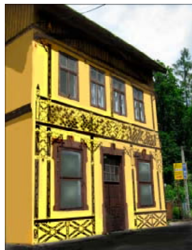
Oczekiwany stan budynku