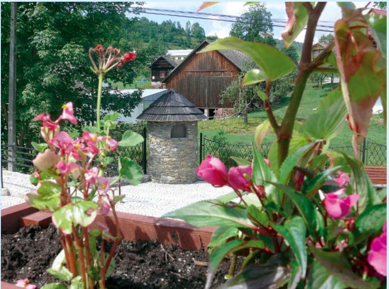
Kolejna wizytówka Jaworek – nowy rynek skupiający już setki turystów. Oficjalne otwarcie 8 sierpnia.