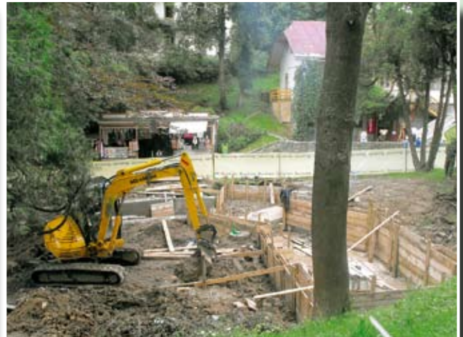
Plac Dietla, konstrukcja żelbetowa sztucznego potoku