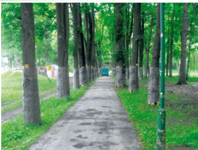
Park Dolny roboty zabezpieczające na starym drzewostanie