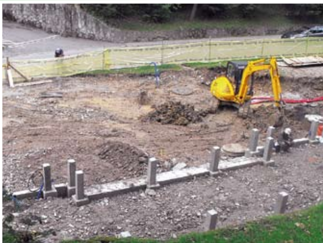
Plac Dietla, fundamenty pod nową pijalnię Magdalena