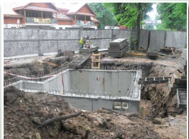
Komora technologiczna fontanny. Park Dolny